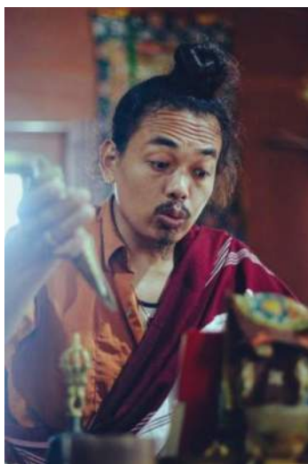
ལྷ་མ་སྐལ་བཟང་འགྲུར་མེད།