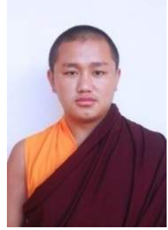
ཚོས་དབྱིངས་ཀྱན་ལྷུ་བ། གཞི་ལེ་ལྷུ་བ།