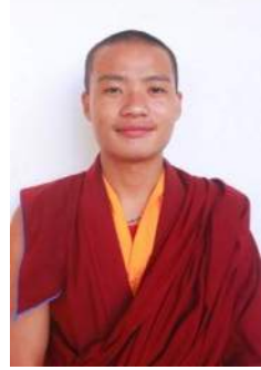
དོ་རྩེ་དོན་གྲུབ། ལོ་རིམ་གསུམ་པ།