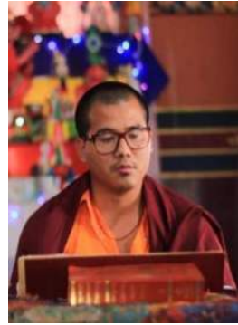
སྐོབ་དཔོན་ཉི་མ་རྒྱལ་མཚན།