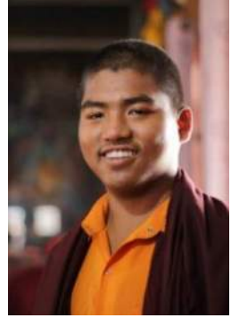
སྐ་ནམ་རྒྱལ། གཞི་རིམ་ལྷ་བ།