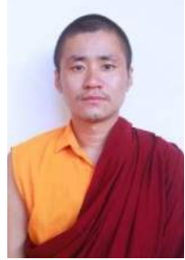
ཡོན་ཏན་རྗེ་ཇེ། ལོ་རིམ་བརྒྱུད་པ།