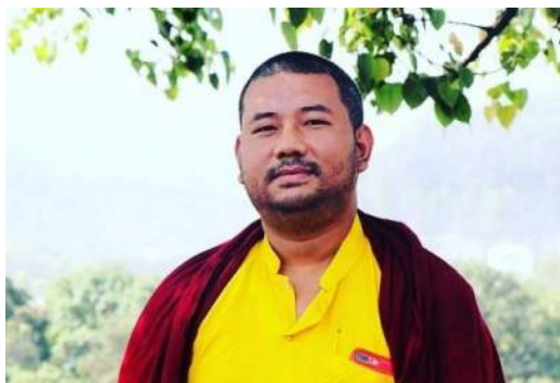
དབུ་འཛོལ་ལྷ་མ་བསོད་ནམས་བཟ་ཤིས།