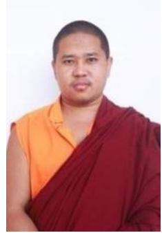
ཤེས་རབ་མཐར་སྲིད། གཞི་རིམ་ལྟུང་།