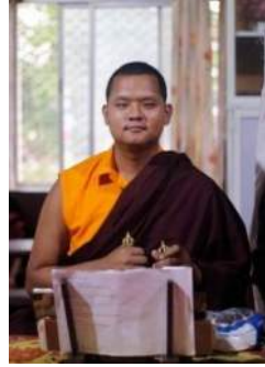
སློབ་དཔོན་ཆེ་རིང་ཚོས་འབེལ།