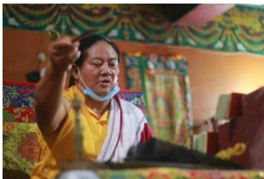
ལྷ་མ་སྐལ་བཟང་ཉི་མ་རིན་པོ་ཆེ།