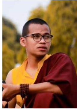
ཤེས་རབ་བསྟན་པའི་བདག་པོ།