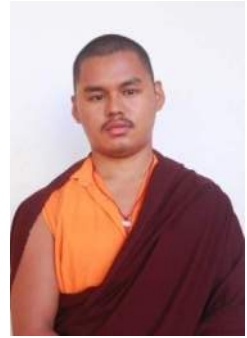
བརྗེ་དབང་གྲགས། གཞི་རིམ་ལྷན་ཁག་གི།