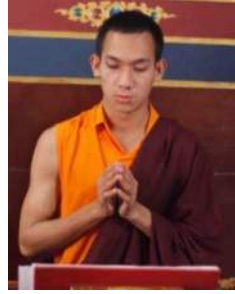
སློབ་དཔོན་ཚེ་རིང་རྣམ་རྒྱལ།