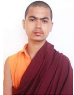
ཡེ་ཤེས་ཚེ་རིང་། གཞི་རིམ་བཞི་བ།