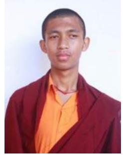
ཡེ་ཤེས་མཐའ་ཡས། གཞི་རིམ་དྲུག་པ།