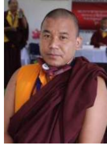
སྐོབ་དཔོན་འགྲུང་མེད་རྡོ་རྗེ།